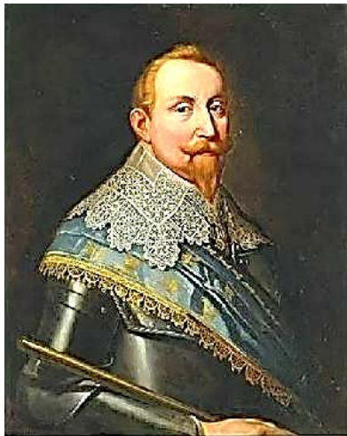
Польский король Густав II Адольф