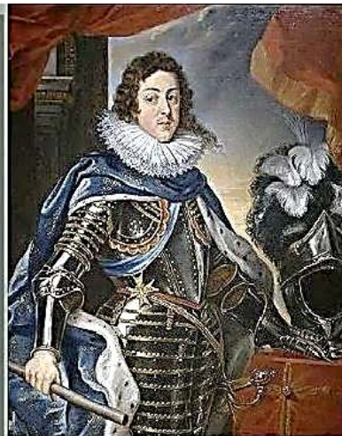
Французский король Людовик XIII