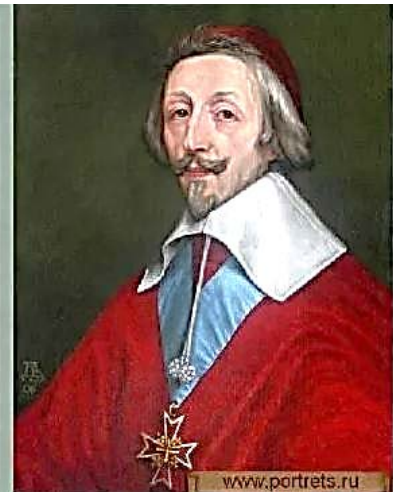
Кардинал Франции Ришелье

Поводом к началу военных действий послужили события 1618 г. в столице Чешского государства – Праге . В результате восстания протестанты захватили королевский дворец и выбросили из его окон наместников австрийского короля.