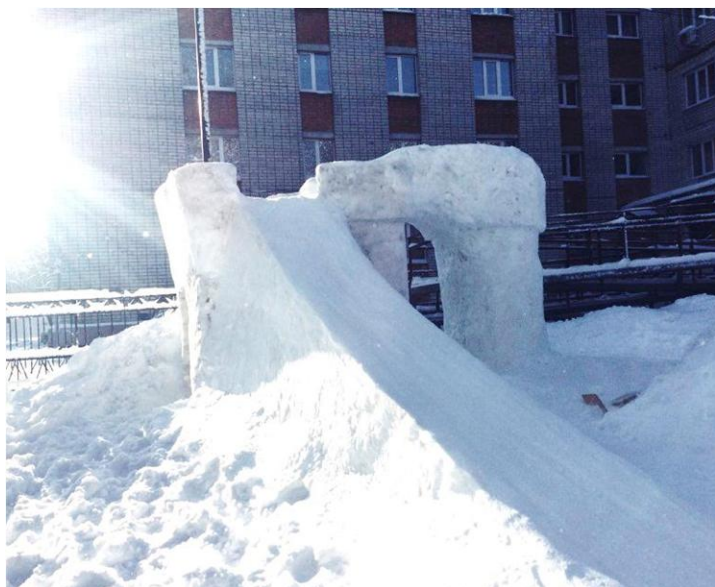
Ледяная горка возле общежития БГУОР

Удивительное время года. Природа преподносит нам все новые условия его протекания. Мы мхуримся и негодуем, что всё происходящее совсем не соответствует нашим ожиданиям. На Новый Год ждём снега, а ближе к весне всей душой ожидаем тепла. Но, не смотря на то, что снег хлопьями падал лишь к концу зимы, мы успели порадоваться и ощутить все прелести, которые возможны. А помог нам в этом один из наших преподавателей!